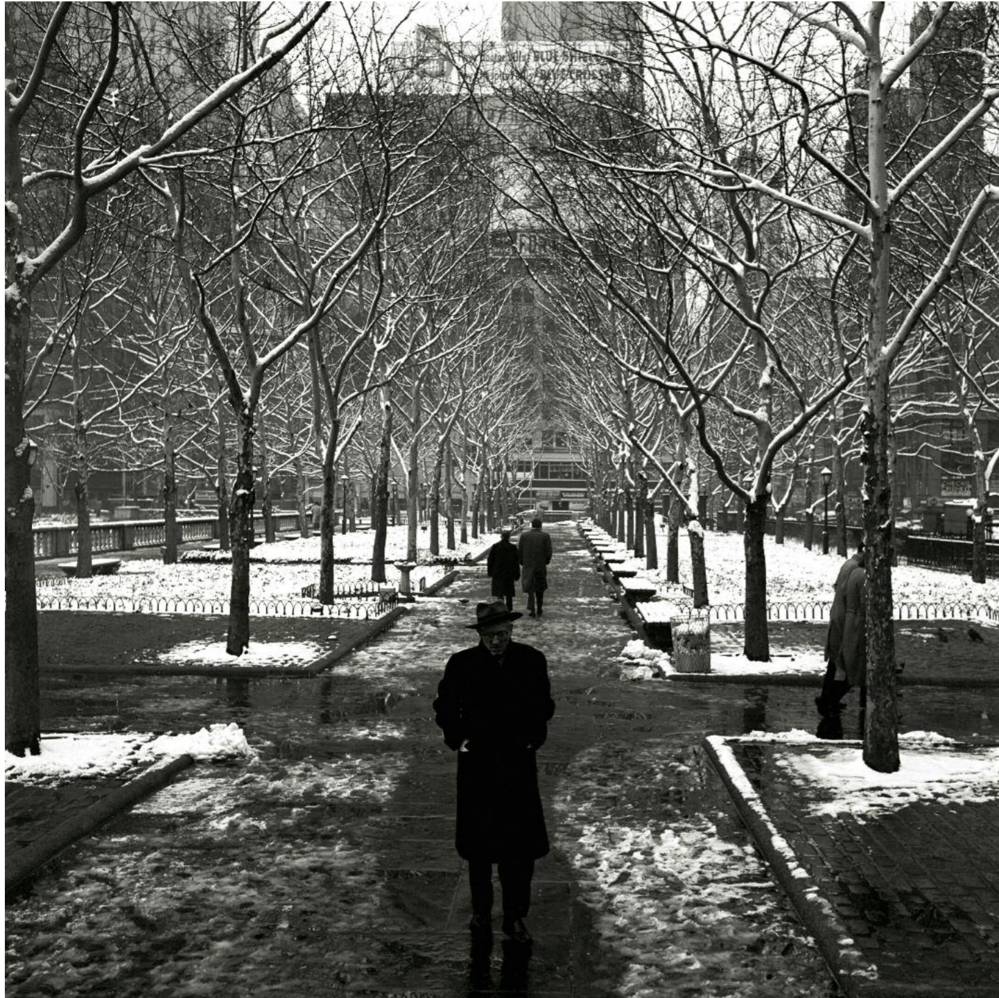
Über ihre Bilder sprach Vivian Maier nie und zeigte sie auch keinem Menschen. 18. März 1955, New York.