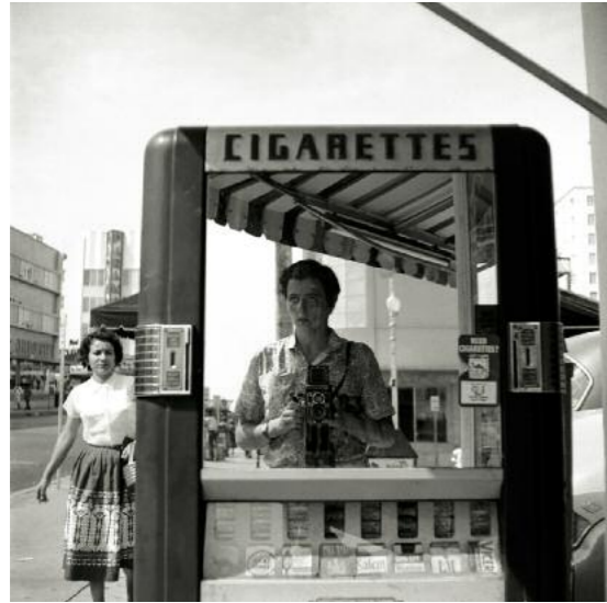
Oben: Immer wieder sieht sich Vivian Maier in Schaufenstern und Spiegeln. Eines ihrer zahlreichen Selbstporträts auf der Front eines Zigarettenautomates, undatiert.