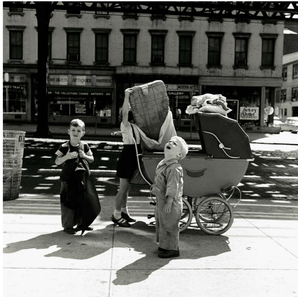
Alle Fotos: © Vivian Maier, Galerie Hilaneh von Kories, John Maloof Collection

Eigentlich suchte der junge Immobilienmakler John Maloof Bildmaterial des Chicagoer Stadtteils Portage Park, in dem er lebt und über den er eine Dokumentation erstellen wollte. In einem Auktionshaus, wo üblicherweise die Sachen von Haushaltsauflösungen versteigert werden, erwarb er Ende des Jahres 2007 für 400 Dollar einen Karton mit 30 000 Negativen, die französisch beschriftet waren. Zuerst die Enttäuschung: nichts über Portage Park, aber jede Menge Motive von Straßenszenen. Über den Fotografen war zunächst nichts bekannt, man wusste nur, dass es eine Frau war, die ihre Mietschulden zu begleichen hatte. Maloofs Leben sollte sich radikal ändern. Er begann über diese Frau zu forschen und kaufte einem Mitbieter jener Auktion weitere Schachteln mit Negativen ab. Am Ende hatte er nicht nur über 100 000 Schwarzweißnegative und 20 000 Farbidapositive, sondern auch einige tausend unentwickelte Rollfilme im Besitz. Zwei Jahre später entdeckte er schließlich auf der Tasche eines Entwicklungslabors den Namen der Fotografin: Vivian Maier. Über