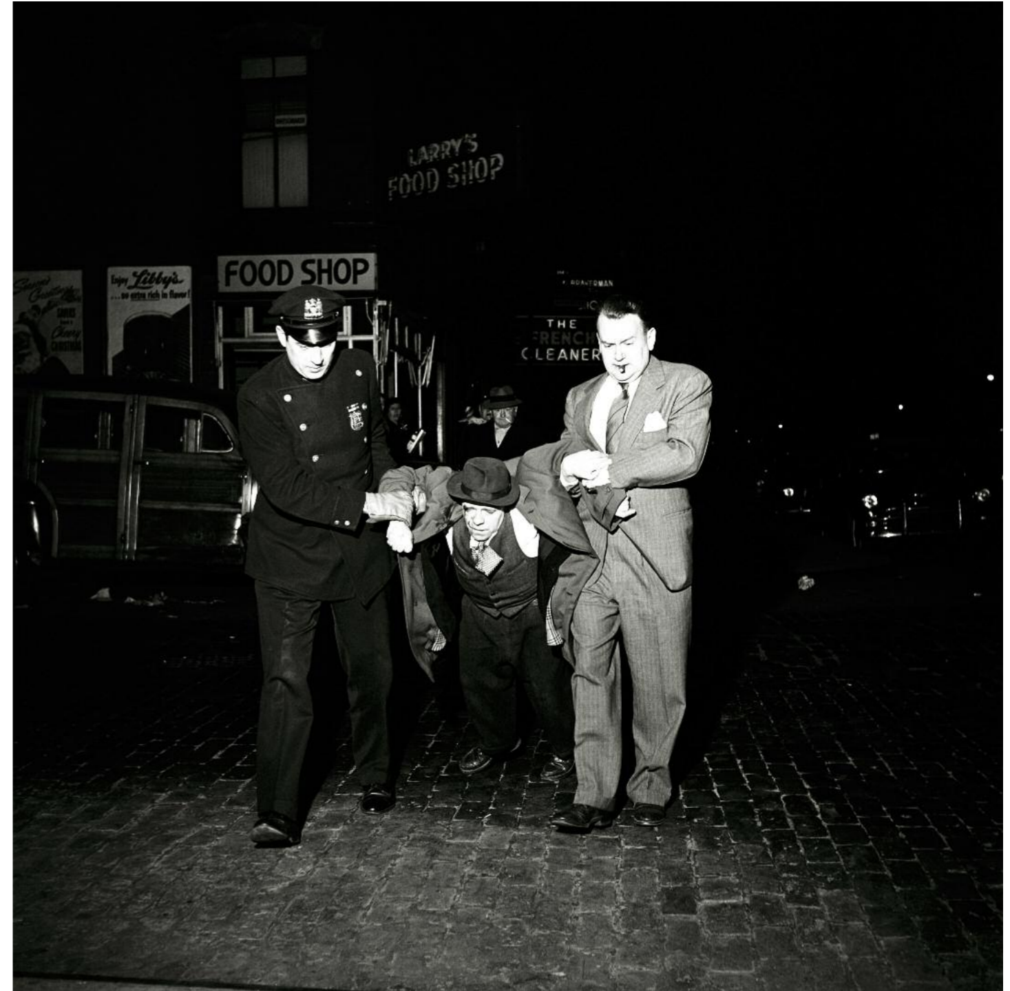
Eine Szenerie, die auch von Weegee stammen könnte. Betrunkener Mann am Weih- nachtsabend 1953, 78th St. u. 3rd Ave., New York.